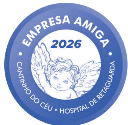
Selo empresa amiga