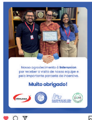
Logotipo e agradecimento do incentivador no Facebook, Instagram e LinkedIn