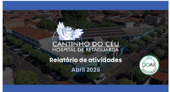
Relatórios de atividades encaminhados mensalmente e anualmente