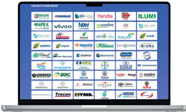
Logotipo do apoiador no site