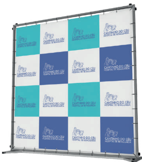
Backdrop e parede estratégica com os logos das empresas incentivadoras