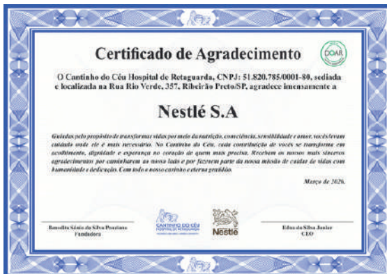
Certificado para as empresas Incentivadoras